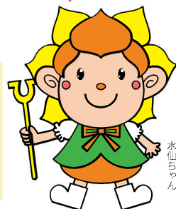
東吾妻町マスコットキャラクター 水仙ちゃん