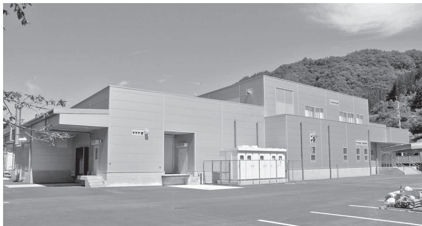
▲給食センターの全景

給食配送計画案については、タイムスケジュール、検食、運営管理費などの質問があり、また、スクールバスの運行については、停留所の位置、公共交通との調整、運行経費などの質問がありました。