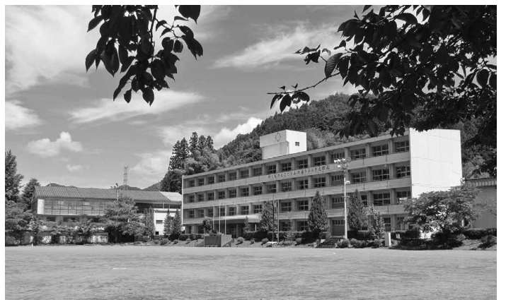
▶現在の岩島中学校 統合後の廃校舎の活用方法が課題となる