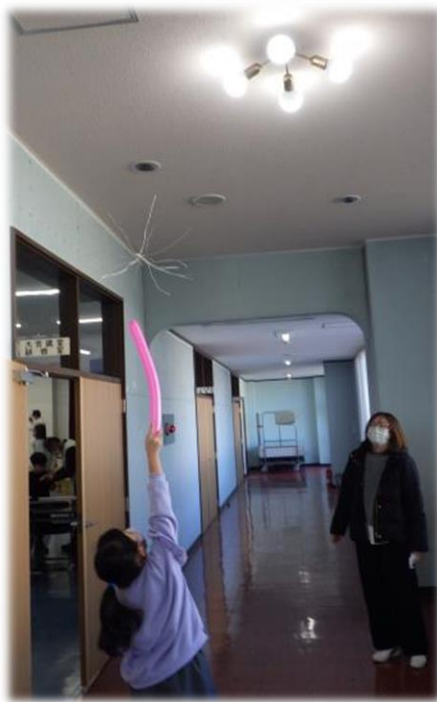
※静電気のでふわふわ浮かぶよ