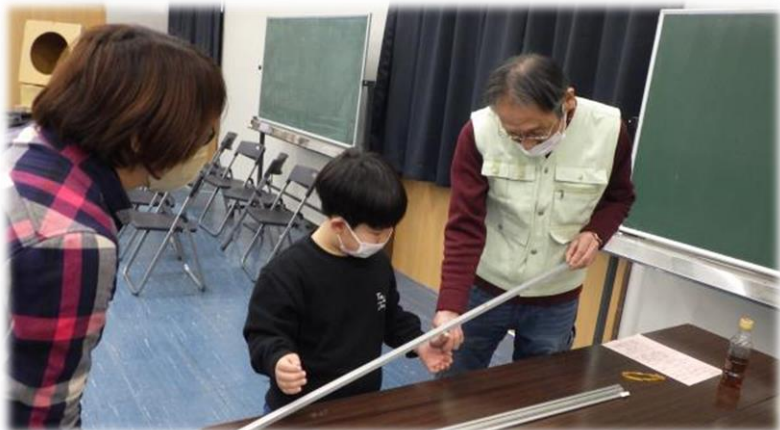
※磁石の球とアルミパイプの不思議な現象体験中

おもしろ科学教室は、小学生を対象とした体験型の講座です。実験を通して科学のおもしろさや自然の不思議に触れ「もっと知りたい」という気持ちを育むことを大切にしています。次年度も10月と2月に東吾妻町で開催予定です。ぜひご参加ください。