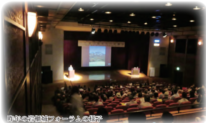
昨年の岩櫃城フォーラムの様子

第1回では岩櫃城そのものを、そして第2回では岩櫃城を取り巻く情勢、他城郭の様相などより広い視野から岩櫃城を考えるきっかけとしたいと思い、今回のテーマを設定しました。戦国時代の終焉。それは新しい時代へと動き出すその混乱期でもあります。その混乱期をどのように岩櫃城は乗り切り、その役目を終えるに至ったのか。皆さんと一緒に考える貴重な機会としたいと思います。平成29年10月28日、多くのかたがたのご来場をお待ちしております!