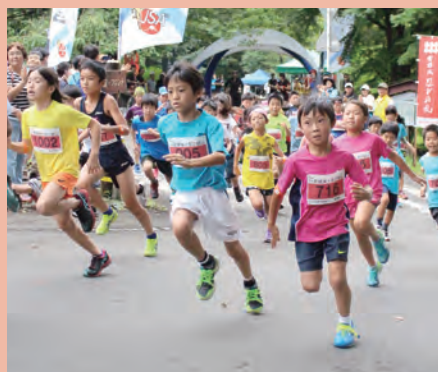
←ジュニアコーススタート 一般コーススタート→

8月20日(日)に第3回 THE 岩櫃城*忍び登山がコニファーいわびつを発着点に開催されました。同イベントは岩櫃山周辺を駆け抜けて、東吾妻町の自然とスカイランニングを楽しんでもらうため企画され、今回は県内外から約160人が参加しました。