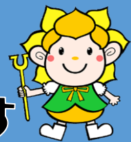
東吾妻町マスコット 「水仙ちゃん」