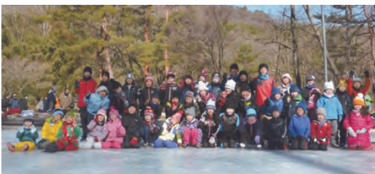
※写真は第17回スケート講習会（1月11日実施）