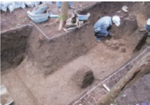
第2トレンチ 確認された道路跡

設置し、調査を進めます。現在は貯水池東側、主に東の木戸といわれている箇所周辺の調査を行っています。ここは城下町地区の東側を区切る堀切りと堅堀が確認されており、その規模を調査しているところです。