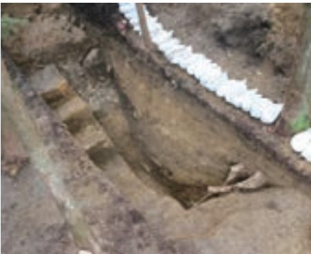
第1トレンチ 堀切り

現在の貯水池周辺に位置していたとされる城下町は北・東・西を木戸による入口とした空間と考えられ、その外縁部は林内に残る堀や堀切りによって仕切られているとされています。今回の調査ではその堀を対象にし、遺構の残存状況を確認することともに、堀が確実に城下町地区の内と外を分ける施設であることの確証をつかむことを目的としました。 調査トレンチは貯水池東側の林内に残る堀切り周辺に2本、岩櫃神社北側に延びている堀に対して2本（予定）を