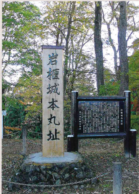
岩櫃城本丸址 標高 593m に立地する東西約 140m、南北約 35m の主郭を中心として、岩櫃山から東へ延びる 4 本の尾根上に、広域的に曲輪を配置するなど、その規模は群馬県内の中世城館でも最大規模を誇る。25m × 15m の建物の土台状の遺構があり、展望台、指揮台を兼ねての中樞部と考えられている。