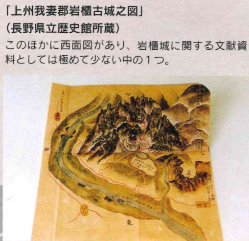
「上州我妻郡岩櫃古城之図」 （長野県立歴史館所蔵） このほかに西面図があり、岩櫃城に関する文献資料としては極めて少ない中の一つ。