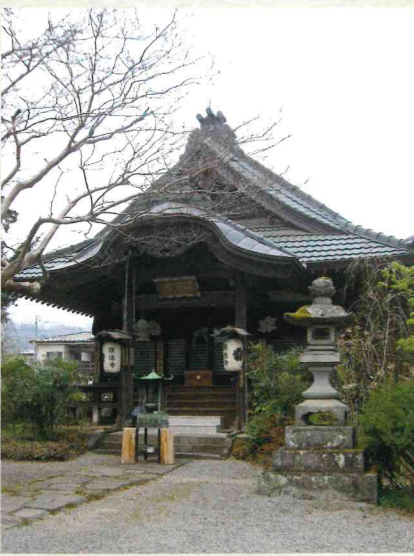
頭徳寺本堂 現在の本堂は一部修復してあるが、明治当時のもの。