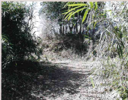
「東の木戸」 西の木戸と対応し、城下町の東端を固めていた。