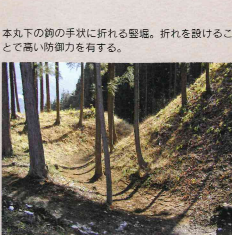
本丸下の鉤の手状に折れる堅堀。折れを設けることで高い防御力を有する。