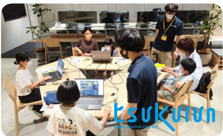
デジタル人材育成拠点「tsukurun」

【問】 県ではデジタル人材育成拠点として昨春に「tsukurun(ツクルン)」を開設。小中学生から、最先端のデジタル教育環境を提供し、実践的な創作活動を行う全国初の施設である。今年度はそのサテライト支援事業として要望のある県内各自治体を支援して、デジタル人材育成環境を広げることになった。一方、当町は深刻な少子化に直面している。2007年の町の出生数は約100人。昨年度には31人。15年で7割減になってしまっている。「tsukurunサテライト」を町が受けければ、