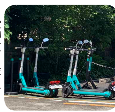
電動キックボード

地方税法および道路交法の一部改正を受け、電動キックボードと一般的に呼ばれる特定小型原動機付自転車の税率等を新たに規定し、年額2000円を課税するものとなります。