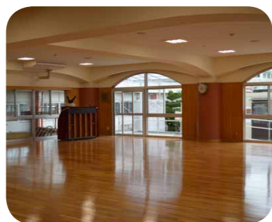
改修した学童施設

議会運営委員会、および議員全員協議会で慎重に協議をし、委員会発議により予算決算特別