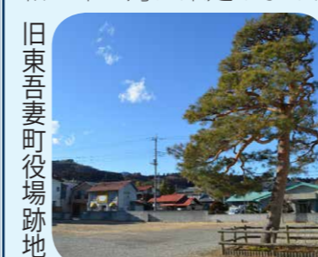
旧東吾妻町役場跡地

「群馬原町駅南側地区まちづくり計画」と「ぐんま"まちづくり"ビジョン東吾妻町アクションプログラム」を令和5年3月に策定しました。