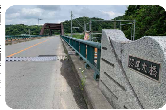
渋川市と共同で工事を行っている沼尾大橋

一般会計は、歳入歳出にそれぞれ1億6880万円を追加し、総額をそれぞれ85億4472万円としました。物価高騰対策で、通算4度目の住民1人1万円の商品券の支給や低所得世帯(非課税世帯)へ3万円支給などの対策を盛り込みました。