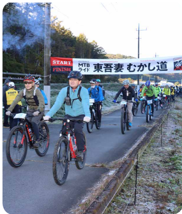
東吾妻むかし道MTBライド

【問】 当町には豊富な森林資源がある。国でも再生エネルギーの新たな価値の創設や小規模地域内エコシステム事業等を推進しており、さらなる木質バイオマスによる発電熱電併給の循環型エコシ