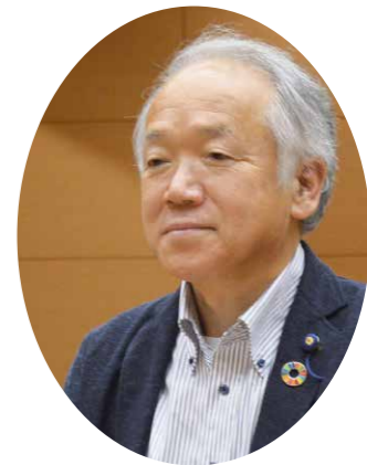
たかはしのりき 高橋徳樹議員