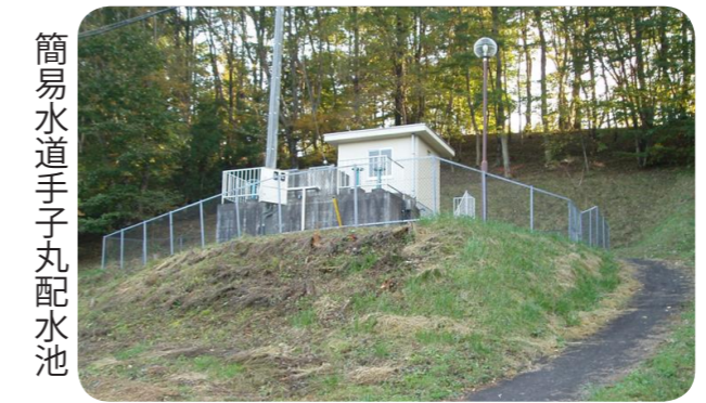
簡易水道手子丸配水池

【町長】 令和6年4月より公営企業会計に移行することにより、町の水道事業は、地方公営企業法適用の水道事業会計および簡易水道事業会計の2つの会計となる。将来的には会計を統合し、料金体系についても整合を図りながら、料金は同額とし、水道事業を一つにして管理、運営をしていきたいと考える。