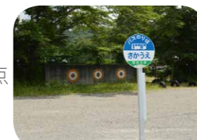
さかうえ拠点バス停