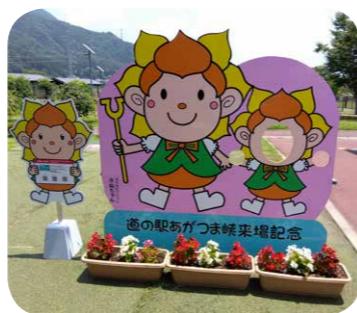
道の駅あがつま峡

委員からは、現在各分団にある消防自動車は原則20年で更新計画しているが、年々購入価格が高くなっており、過剰装備にならないよう意見が出されました。