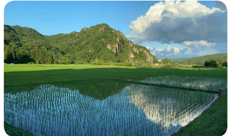
守るべき美しい田園風景

【町長】 一つ目には、今年度より農業の担い手を増やすために「農業担い手受け入れ協議会」を立ち上げ、新規参入者を受け入れる体制づくりを始めた。二つ目は、「人・農地プラン」に位置付けられている49歳以下の新規就農者に対して年間15