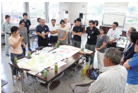
住民ワークショップの様子（平成29年8月）

会議の開催回数は、年4～5回を予定しています。会議1回の出席につき7700円（報酬）と車代等の交通費（費用弁償）を支払います。