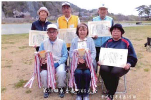
第34回東吉美町GG大会