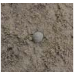
鉄砲玉出土状況(本丸)

これまで紹介しましたもののほかにも、硯や碁石といった石製品も展示される予定です。令和元年6月1日から7月21日まで東京の江戸東京博物館で展示されます。また、全国の博物館では花巻市博物館(岩手県)・三内丸山遺跡センター(青森県)・名古屋市博物館(愛知県)・市民ミュージアム大野城心のふるさと館(福岡県)をおよそ1年かけて巡回します。これを機会にぜひ岩櫃城の知られざる地中に眠る姿の一端に触れてみてください。