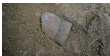
内耳土器(鍋)出土状況(本丸)