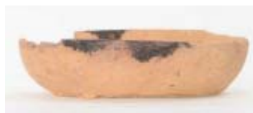
本丸から出土したかわらけ