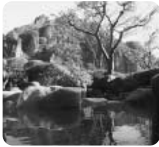
自然岩を配した庭園風露天風呂

また、桔梗館では「絵画」「書道」「写真」などの作品を館内の廊下などを利用し発表の場を提供いたします。グループなどでご検討してみたいかがでしょうか。皆さまのお越しをスタッフ一同お待ちしております。