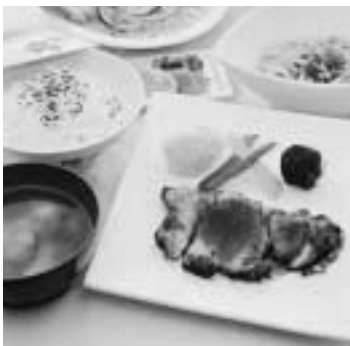
スポーツイベント強化練習 応援プランメニュー

今年も榛名湖において、5月18日・19日の「榛名山ヒルクライムin高崎」に始まり、夏のトライアスロンや秋のフルマラソンなどの大きな大会も計画されています。