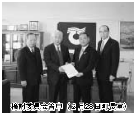
検討委員会答申（2月28日町長室）