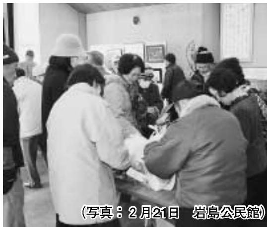
(写真：2月21日 岩島公民館)

2月21日に岩島公民館で、3月3日に太田公民館で老人クラブ連合会作品展示即売会が実施されました。会場では会員たちが用意した農作物や加工品などが飛びように売れました。また、会場には絵画や書道などの作品も展示され来場者を楽しませてくれました。